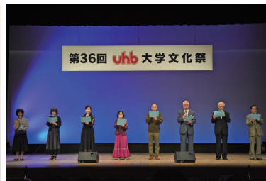
文化祭舞台発表より