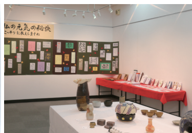
文化祭作品発表より