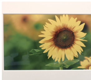
〈写真講座〉濱口徹さん 作品